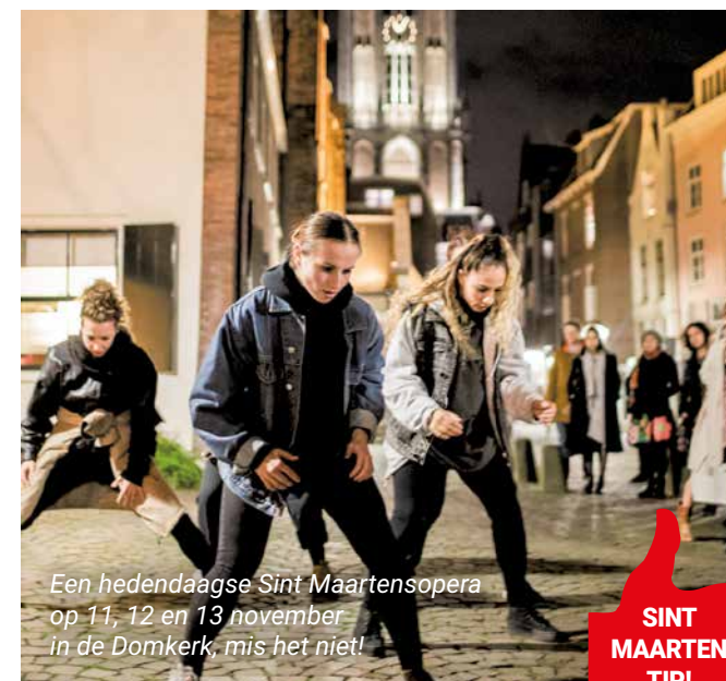
Een hedendaagse Sint Maartensopera op 11, 12 en 13 november in de Domkerk, mis het niet!

Met de ontsteking van de feestverlichting en de viering van Sint Maarten gaat 'Winter Utrecht' voor de vijfde keer van start. Kijk op winter-utrecht.nl