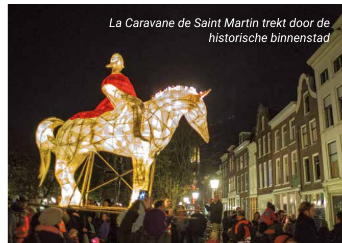
La Caravane de Saint Martin trekt door de historische binnenstad

Verzamelen op het Damplein om 17.30 uur 18.00 – 20.30 uur (eindpunt bij Museum Catharijneconvent) De Sint Maarten Parade krijgt dit jaar een internationaal tintje. De feestelijke optocht met het verlichte paard zit boordevol muziek, performance en prachtige lichtbeelden uit alle windstreken. De route is te vinden op sintmaartenparade.nl .