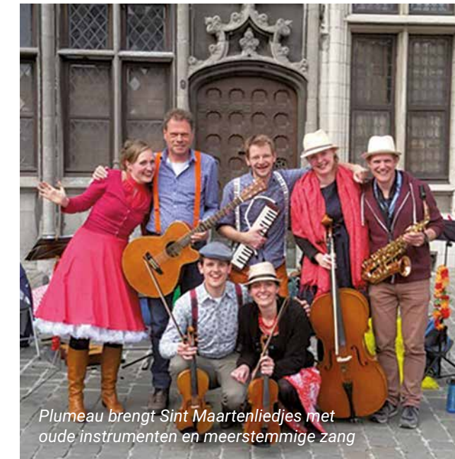
Plumeau brengt Sint Maartenliedjes met oude instrumenten en meerstemmige zang

Zondag 6 november DEEL, HAAL, BRENG EN LACH!