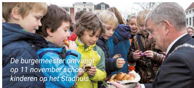
De burgemeester ontvangt op 11 november schoolkinderen op het Stadhuis.