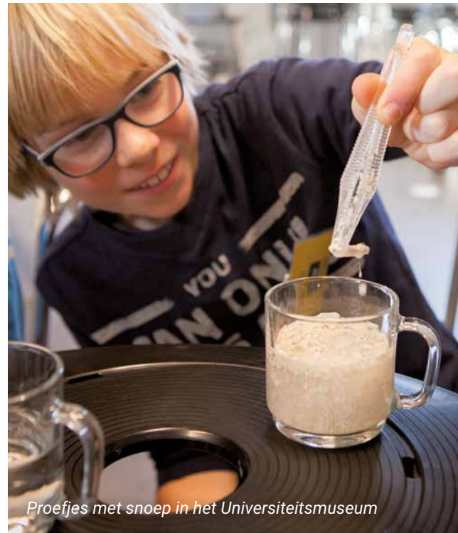
Proefjes met snoep in het Universiteitsmuseum